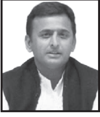
श्री अखिलेश यादव