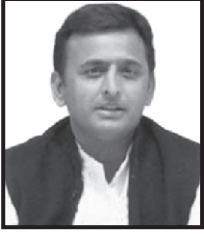
श्री अखिलेश यादव मा0 मुख्यमंत्री, उ0प्र0